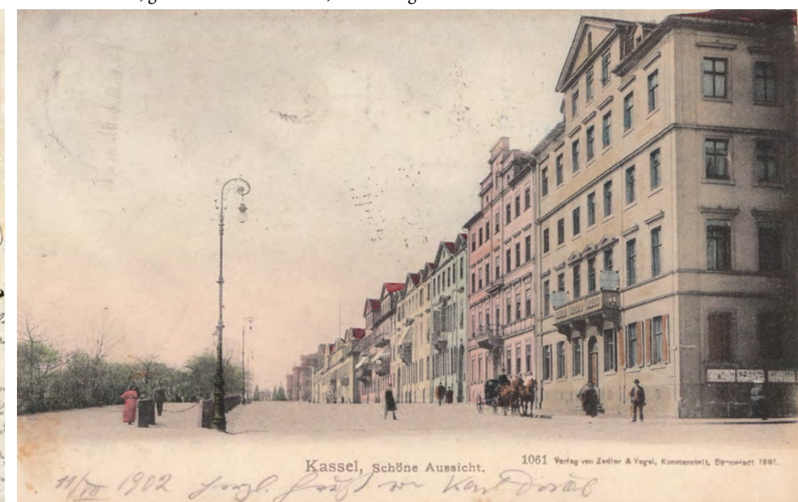
Zwei Postkarten, gelaufen 1900 und 1902, Sammlung FS