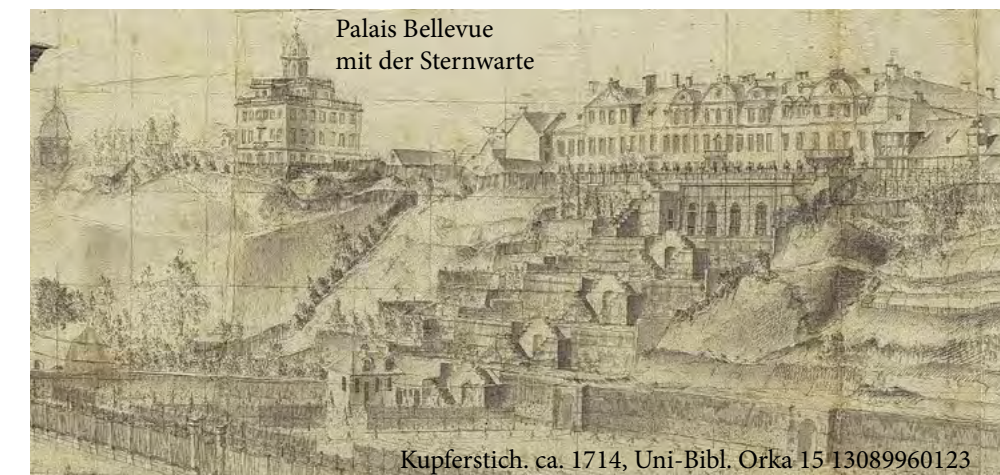
Palais Bellevue mit der Sternwarte