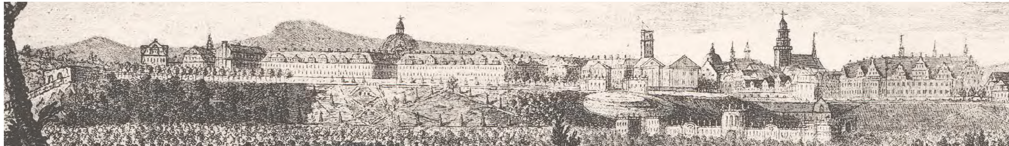
Cassel. J. H. Tischbein del. G. W. Weise, Sc. Vedute auf Plan von Selig 1781, Ausschnitt