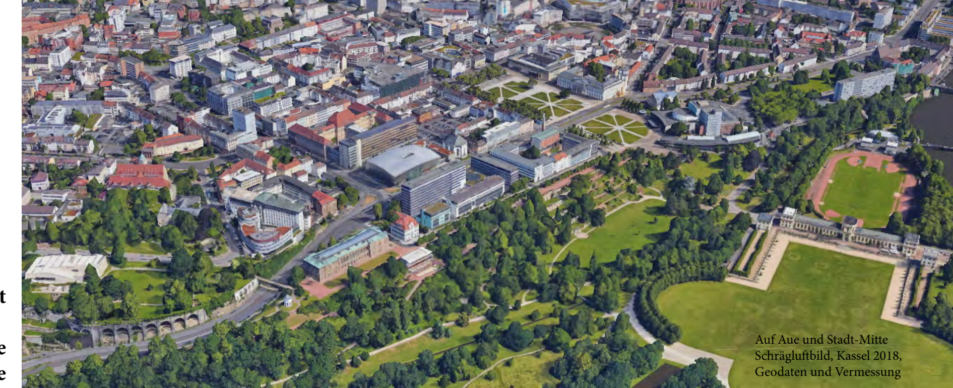
Auf Aue und Stadt-Mitte Schrägluftbild, Kassel 2018, Geodaten und Vermessung