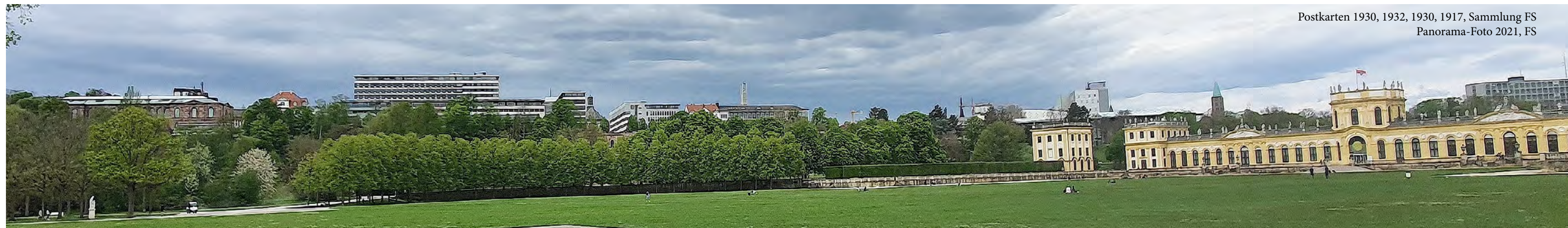
Postkarten 1930, 1932, 1930, 1917, Sammlung FS Panorama-Foto 2021, FS