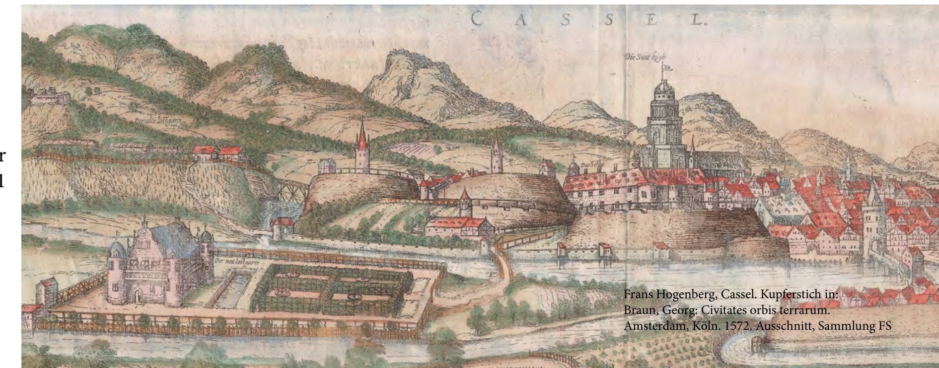
Frans Hogenberg, Cassel. Kupferstich in: Braun, Georg: Civitates orbis terrarum. Amsterdam, Köln. 1572. Ausschnitt