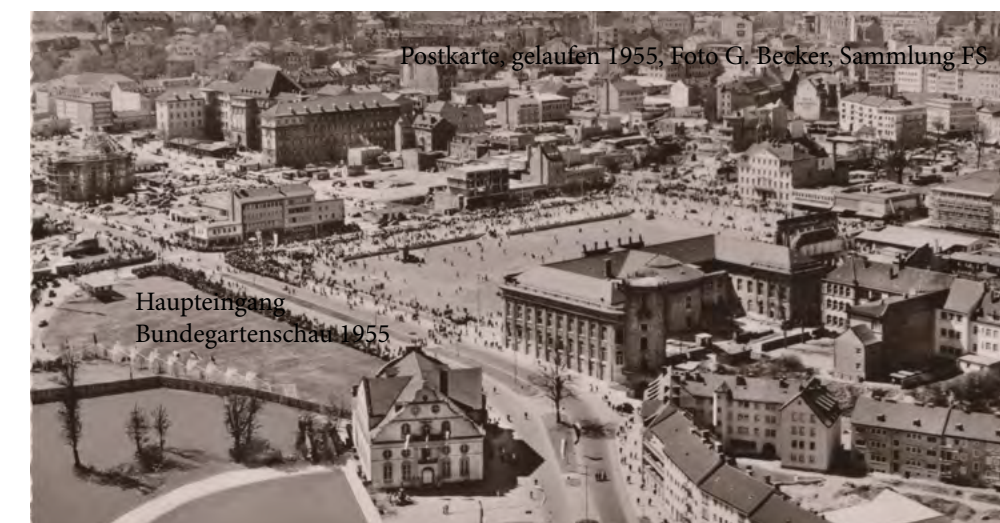
Haupteingang Bundgartenschau 1955