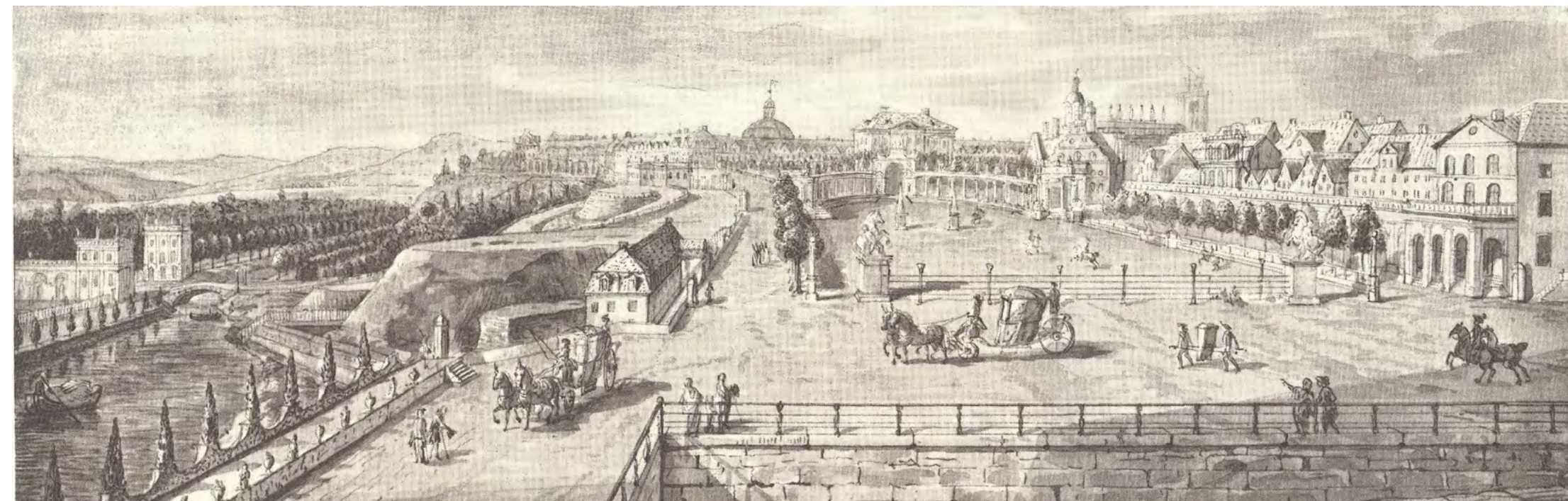
Blick aus dem Landgrafenschloss auf die Aue mit Orangerie, die Rennbahn mit den Kolonnaden und die Oberneustadt. Handzeichnung von J. H. Tischbein d. A., 1782. In: Heidelberg, Paul: Kassel. Ein Jahrtausend Hessischer Stadtkultur. Kassel u. Basel 1973. Tafel 19