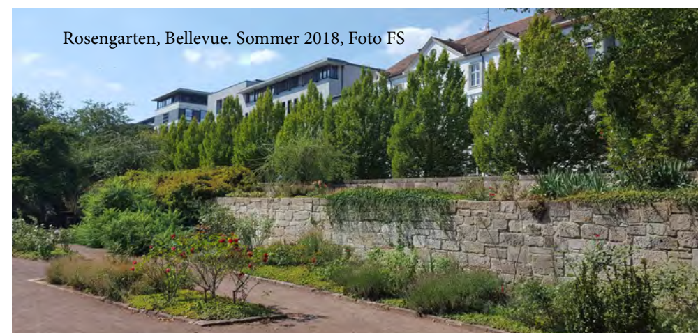
Rosengarten, Bellevue. Sommer 2018