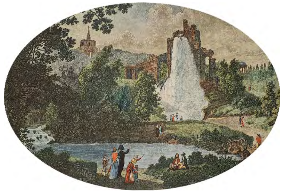
Der Aqueduct. Eine Parthie des Weissensteins bei Cassel, 1798 Nach der Natur gezeichnet von Nahl. Gestochen von F. Schroeder. Die Figuren von G. Schleich. Kolor. Kupferstich, Sammlung FS (Ausschnitt)

Die Große Fontäne C. G. Hammer ca. 1820, Ausschnitt