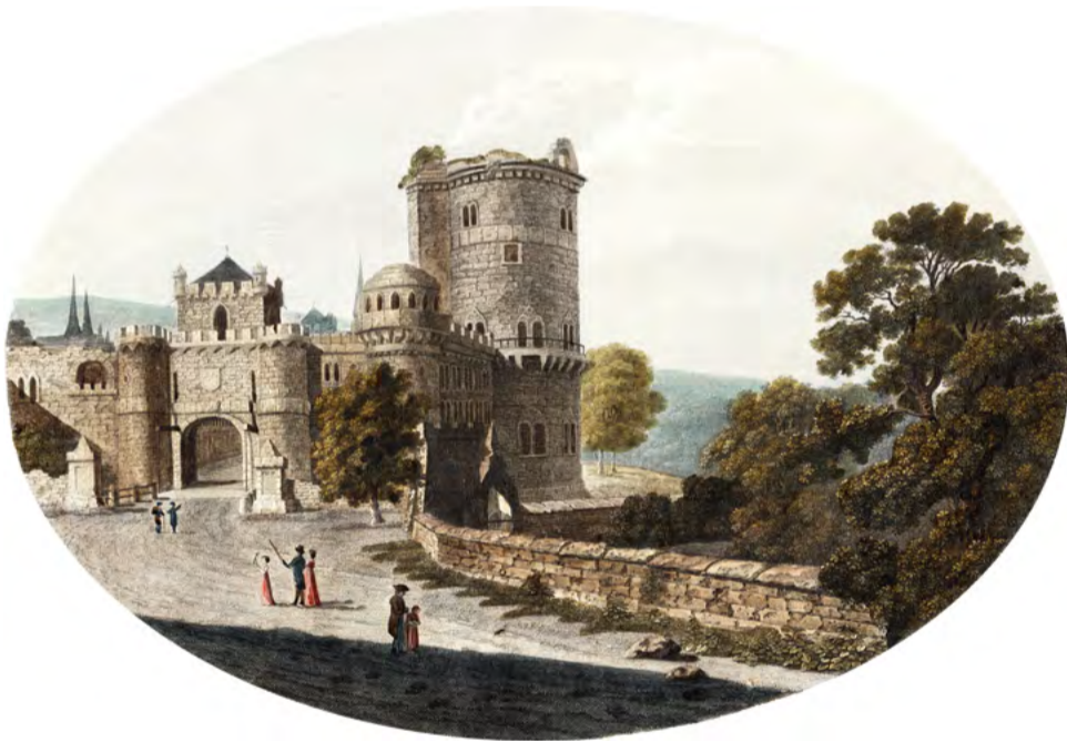
VIII. Die Loewenburg. Eine Parthie von Wilhelmshöhe bey Cassel. Nach der Natur gezeichnet von G. Kobold jun. - Gestochen von F. Schroeder. 1795. Kolor. Kupferstich. Sammlung FS (Ausschnitt)